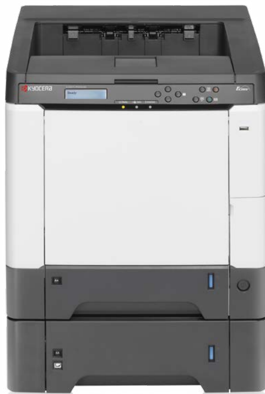
Abb. mit Option